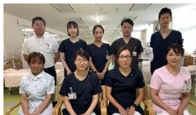
●当院スタッフ一同