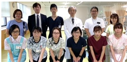
●当院スタッフ一同